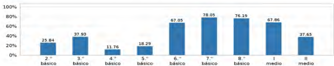
Gráfico 1.2 Porcentaje de estudiantes de cada grado que requiere mayor apoyo en Matemática