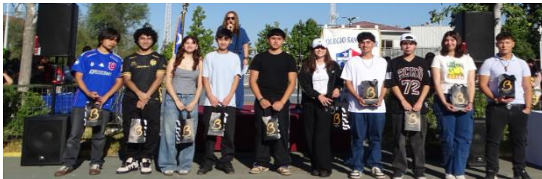
Fotografía Estudiantes generación 2025 reconocidos en acto inicio año escolar 2026

Nos alegramos por estos estudiantes y sus familias. Así mismo, esperamos con las nuevas generaciones que vienen también lograr buenos resultados y así se puedan cerrar un ciclo educativo de excelencia académica, asegurar el ingreso a la Universidad y Carrera profesional de su preferencia.